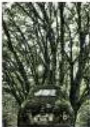
Dieter Klein, Zodanwald 84 x 119 cm, 2011