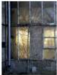
Serge Koch, Treffpunkt Sonne 100 x 75 cm, 2007 (Ausgabe 6)

STAND DER DINGE Serge Koch et Dieter Klein, photographie le mercredi 28.11.2012, 18h30