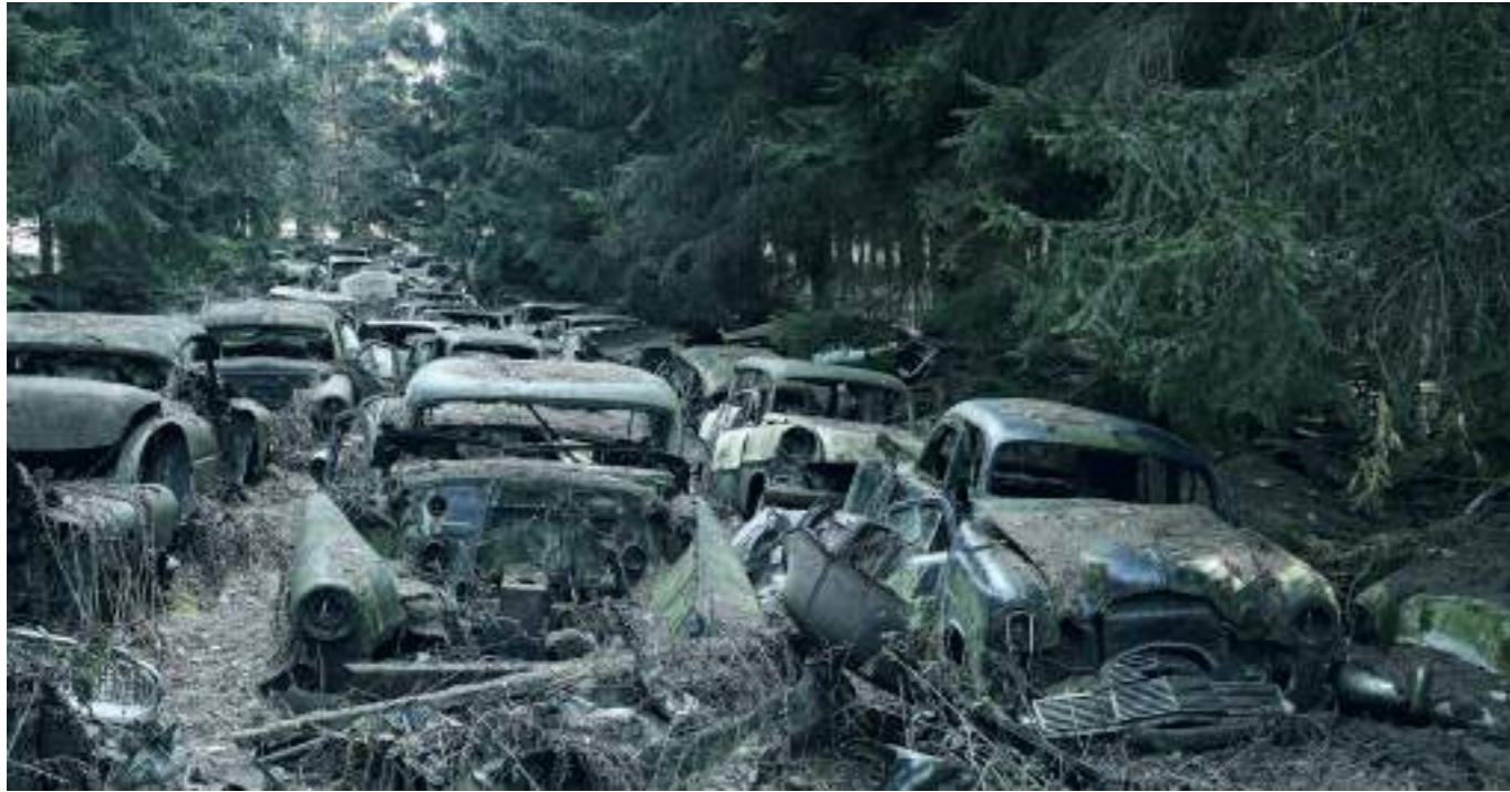
Forest Punk – Die Rotte - 100 x 180 cm