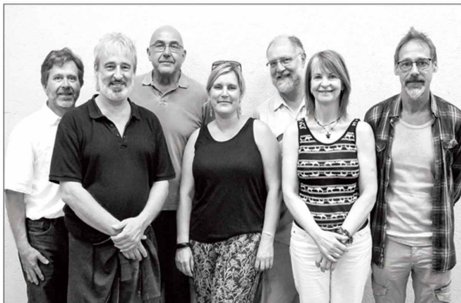
ARC, le comité