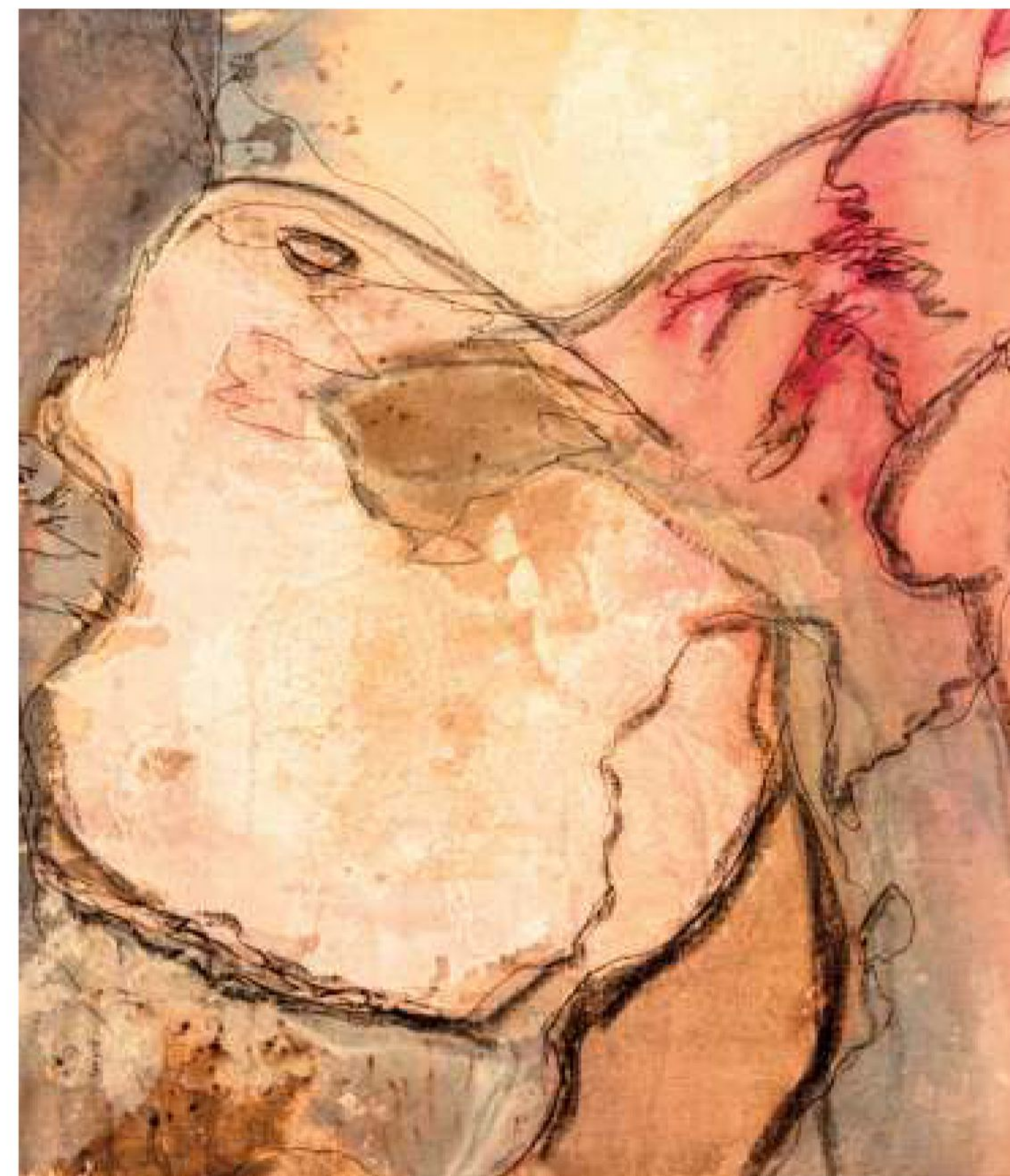
Peinture, de Dany Prum